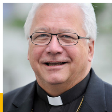
Bischof Markus Büchel

«Der Schutz der Menschenrechte und der Schöpfung muss weltweit gelten.»