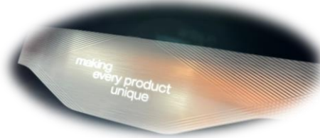
LEONHARD KURZ Stiftung & Co. KG | Fakuma 2023