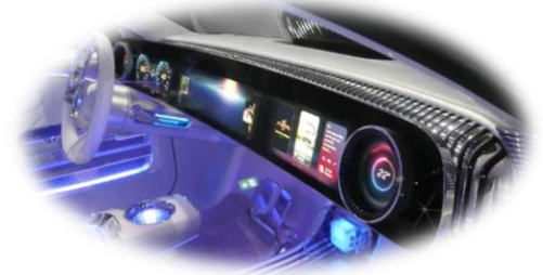
Mercedes-Benz Concept CLA | IAA 2023