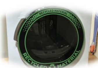
Midea Trockner | IFA 2023