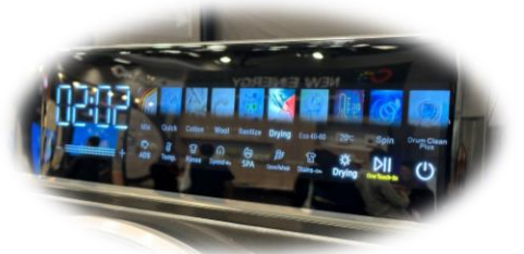
Waschmaschinenblende CHIQ | IFA 2023