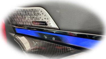
BMW i5 M60 xDrive | IAA 2023