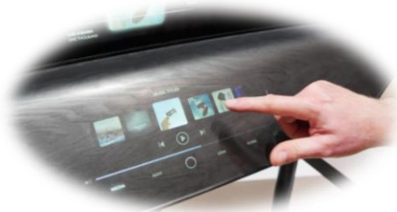
Continental Hidden Display | IAA 2023