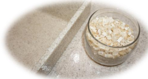
Woodio Waschbecken | ISH 2023