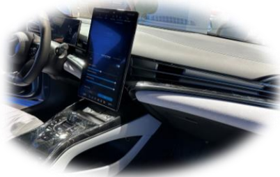
BYD Seal | IAA 2023