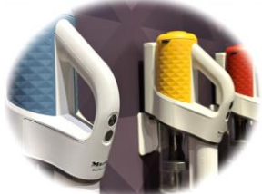
Miele DuoFlex HX1 | vacuum cleaner