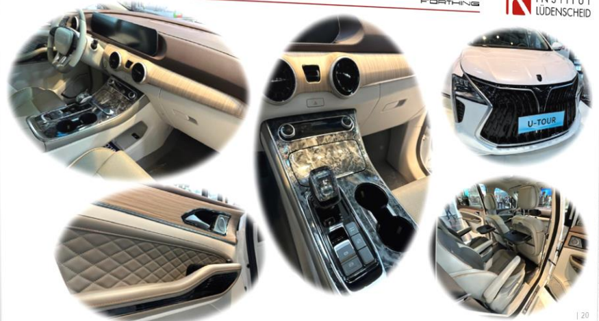
Dongfeng Forthing U-Tour