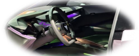
Cupra RAVAL | IAA 2023